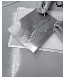
○浜松市立蛸塚中学校 (七月二日)