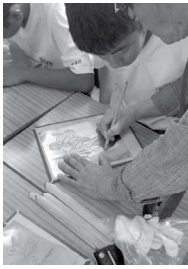
○浜松市立笠井中学校 (七月五日)