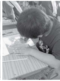
○浜松市立葵西小学校 (六月二十七日)